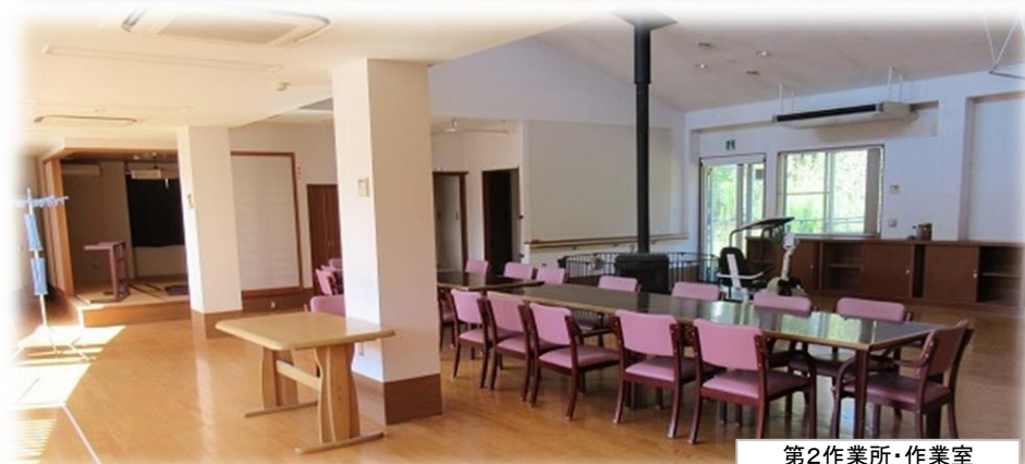
第2作業所・作業室