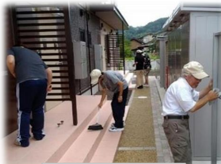
受注業務(アパート清掃)