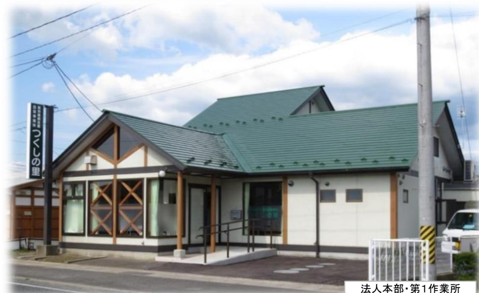
法人本部・第1作業所