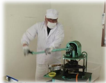
ポンせんべい作り